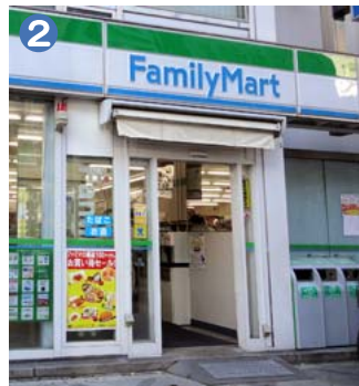
ファミリーマート